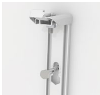
Enkel montering och justerbar i höjdlöd för rätt placering.

För mer info, se filmen på vår hemsida – www.sigarth.com