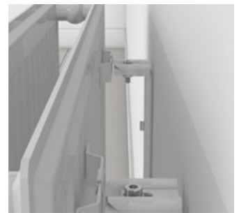
Finns för olika utföranden. För toppmontering på svets-söm eller för dold montering på bygel.